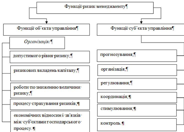
Рис. 1. Функції ризик-менеджменту в банківській установі

Отже, ризик-менеджмент являє собою систему управління ризиком та економічними, точніше, фінансовими відносинами, що виникають в процесі цього управління до основних особливостей ризик-менеджмент. Основними особливостями ризик-менеджменту є: