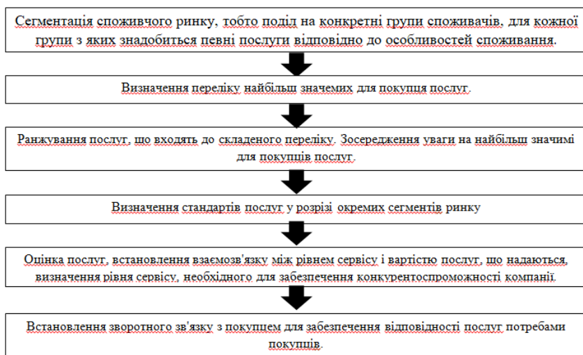
Рис. 1. Послідовність дій по формуванню системи логістичного сервісу на фірмі

Іншими словами, логістичний сервіс являє собою управління потоками послуг. Здійснюється логістичний сервіс або самим постачальником, або експедиторською фірмою, що спеціалізується в області логістичного обслуговування. Оскільки одним з факторів, що впливають на глобалізацію логістики, виступає поліпшення логістичного сервісу, останнім часом зростає інтерес до етапів формування логістичного сервісу (рис. 1) [2, с. 144].