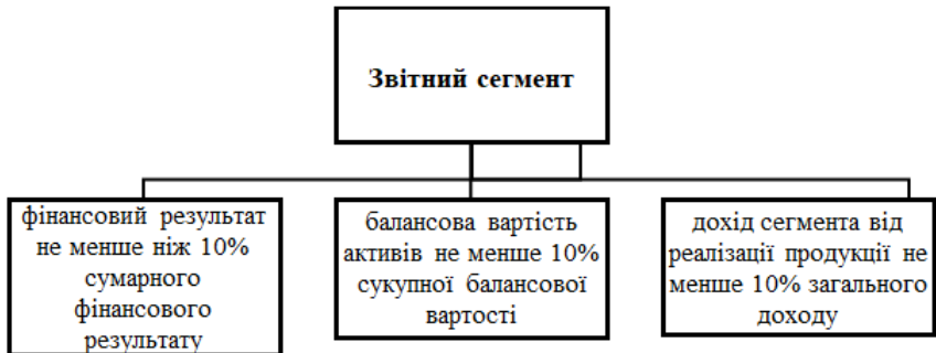
Рис. 1. Кількісні пороги визнання сегмента звітним

На відміну від МСФЗ (IFRS) 8, П(С)БО 29 чітко регламентоване тому відповідно до нього наведемо критерії визнання сегмента звітним за допомогою рисунку 1: